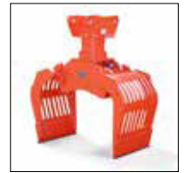
SG 0.5 à 2.0 avec moteur de rotation