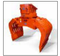
SG 2.3 à 6.0 avec couronne tournante